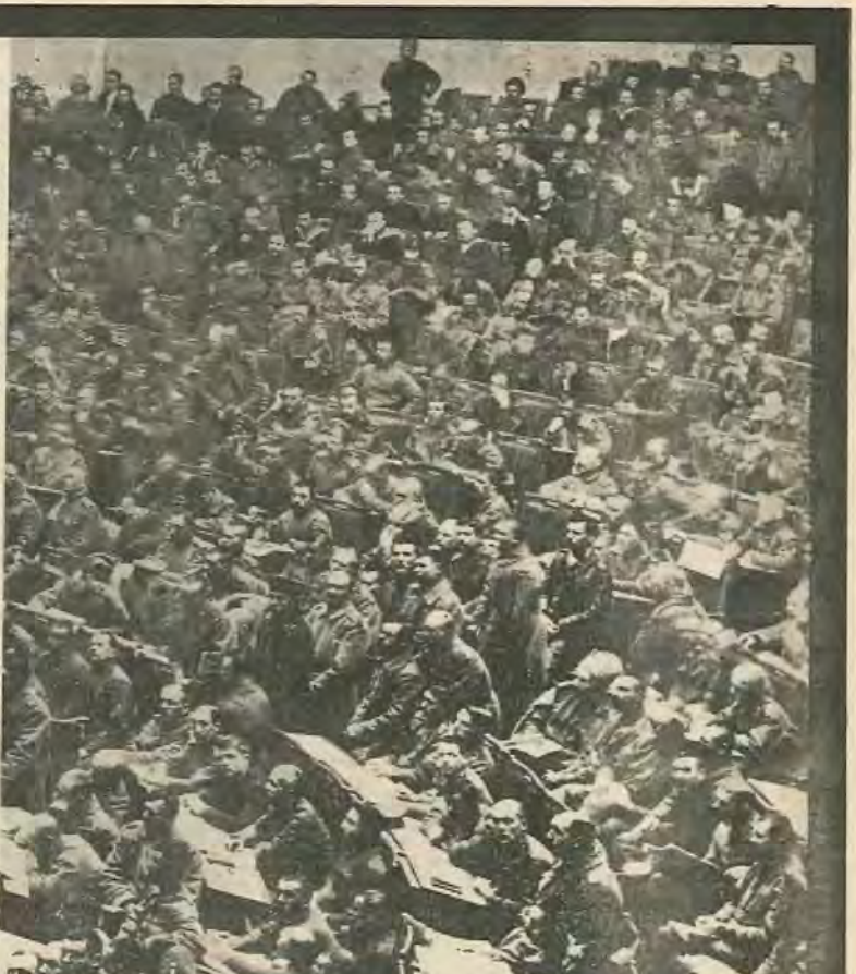
Εργαζόμενοι αποφασιίζουν για τις τύχες του. Το Σοβιέτ συνεδριάζει.